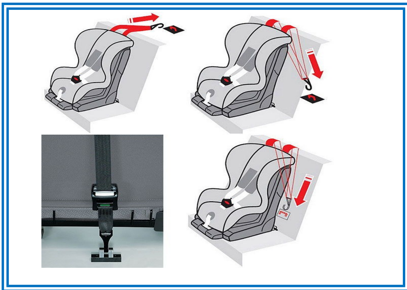
Рисунок 7. Способы фиксации якорного крепления

После того, как автокресло установлено, необходимо учесть ряд условий при усаживании в него ребенка.