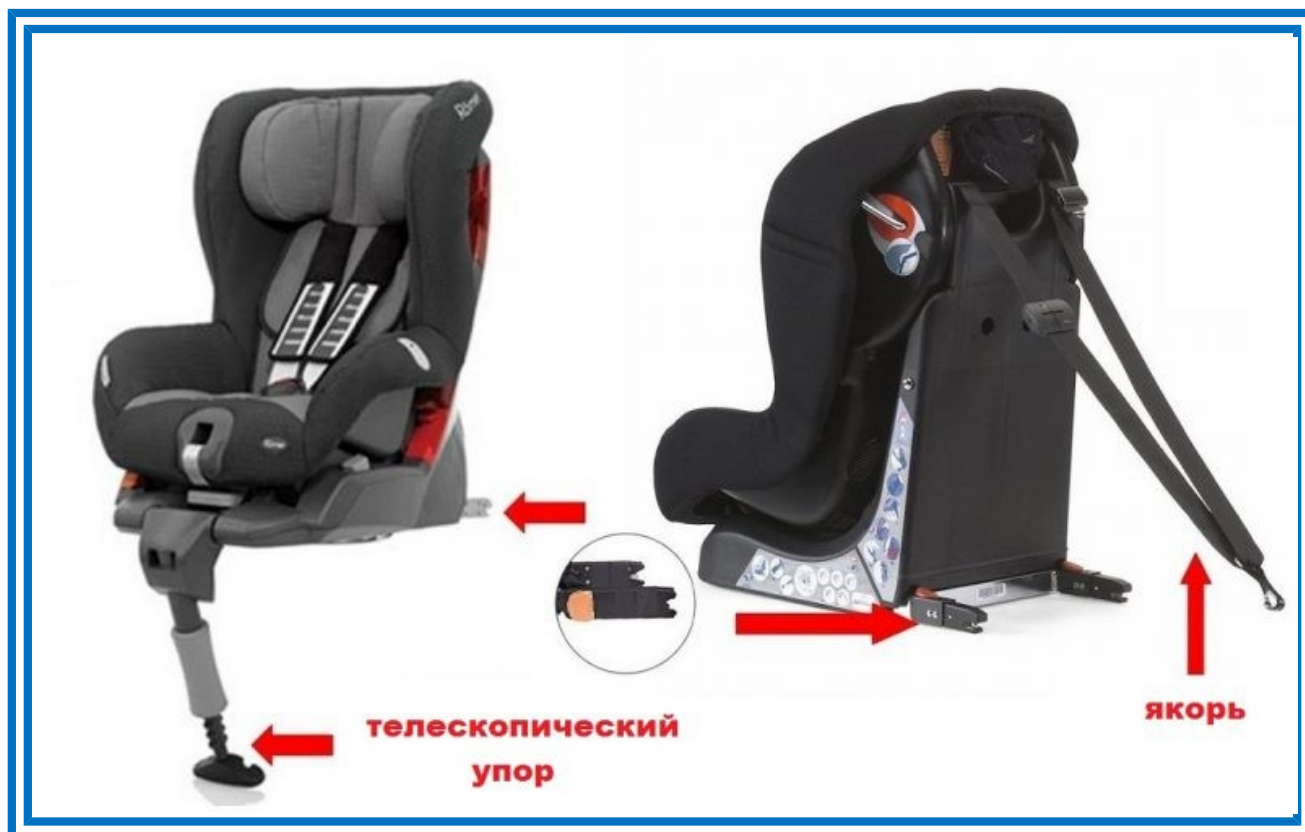
Рисунок 6. Телескопический упор и якорное крепление

Телескопический упор, который еще называют «упорная нога», чаще всего используется в автокреслах с системой Isofix для упора в пол автомобиля, что обеспечивает более жесткую фиксацию детского автокресла.